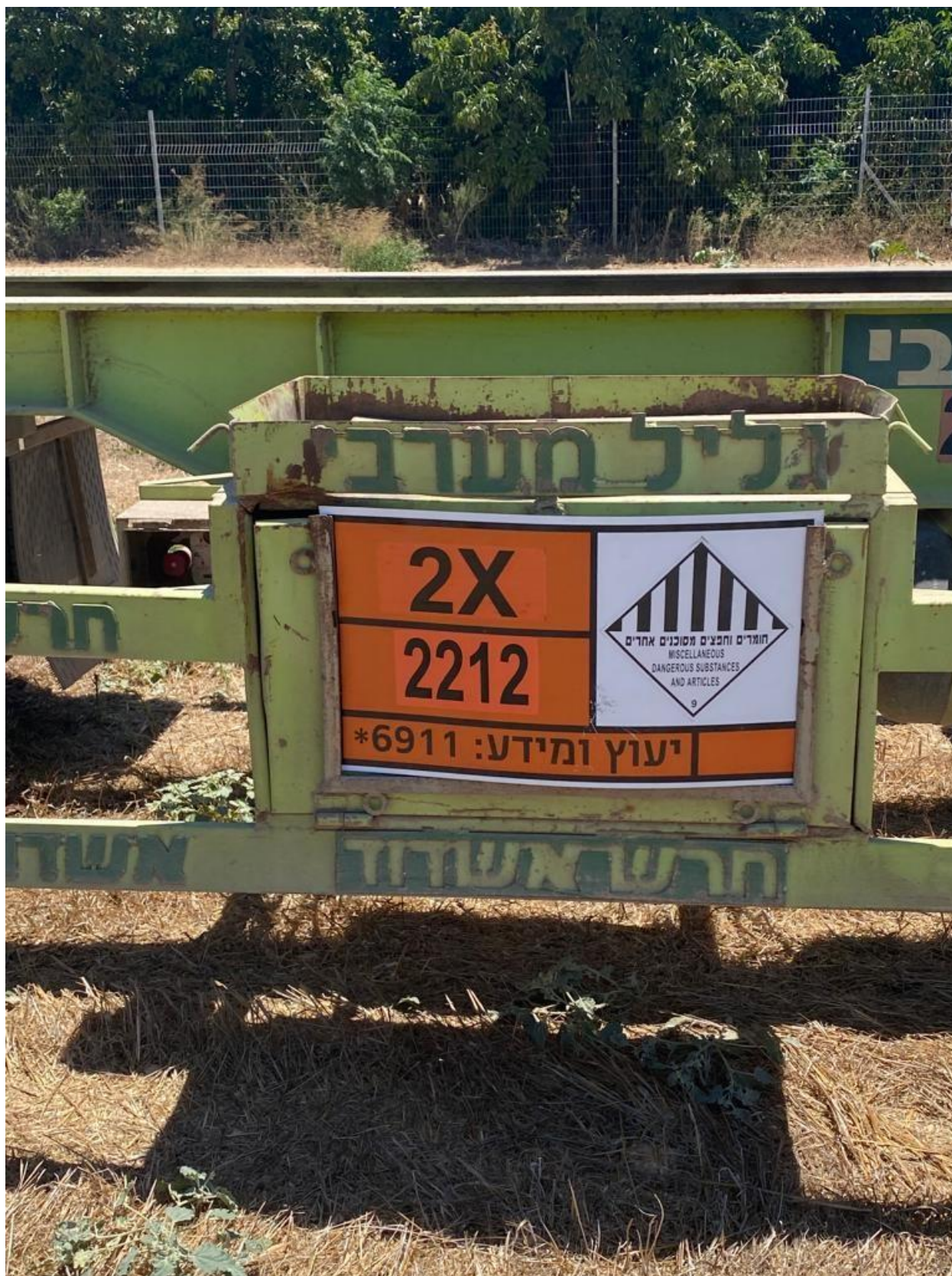
בדיקות במהלך העבודה