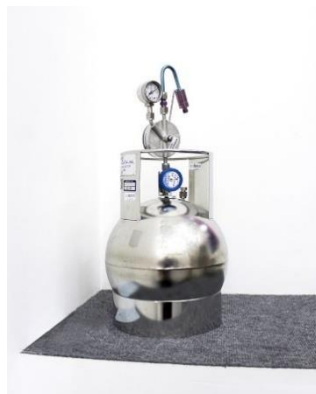
תמונת אילוסטרציה 2. קניסטר לבדיקות לפי שיטה TO - 15