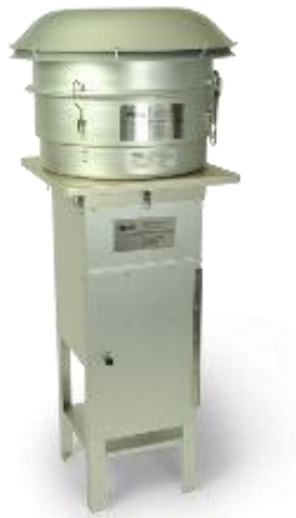
תמונת אילוסטרציה 1. מכשיר HVS לאיסוף אבק מרחף PM10