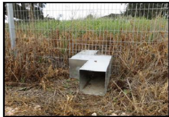
גדר הכוללת מעבר ייחודי המותאם לתנועת בעלי החיים

הפרויקט מלווה על ידי רשות הטבע והגנים (רט"ג). הגדר תכלול מעברים ייעודיים לבעלי חיים בכל 50 מטר. הצוות צופה שתהיה תנועת בעלי חיים החוצה בזמן העבודות וידע לטפל בכל אירוע כזה ברגישות, כפי שהתמודד בעבר, במתחמים אחרים. עיריית הרצליה שותפה לנושא וכפי שסייעה בפינוי בעלי החיים בעבר, תירתם לנושא גם בפרויקט זה במידת הצורך.